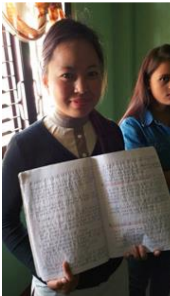
勉強が楽しくて仕方ない様子の バンダナさん