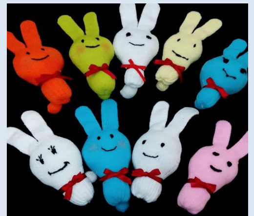
色々な表情のお人形が出来ました