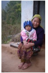
バンダナさんのお母さん

私たちの支援がネパールの若者の自立に繋がっていることを実感できる、嬉しいお便りでした。